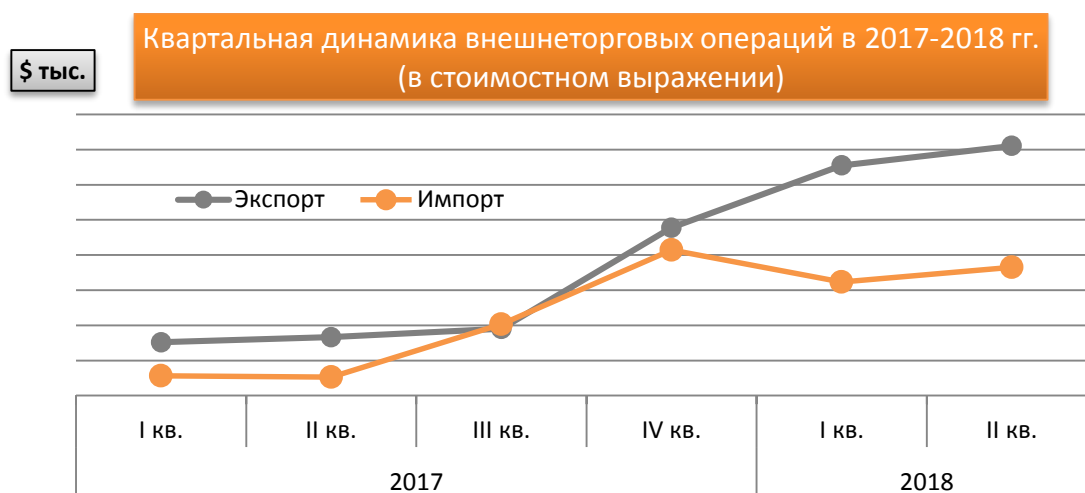
Рисунок 2 Динамика внешнеторговых операций (в стоимостном выражении) в 2017- 2018 гг.

Средняя стоимость тонны экспортной дробы по итогам 1 плг. 2018 выросла относительно предыдущего периода на 5,2%, средняя цена импорта упала на 54%, что объясняется поставками украинской дешевой дробы (Таблица 4).